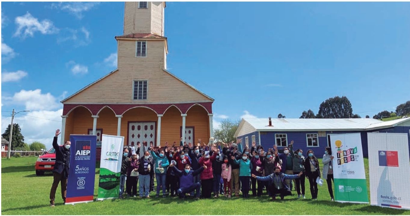
Proyecto Innova Fosis para desarrollo sostenible de microproductores en Isla Quehui, Chiloé.